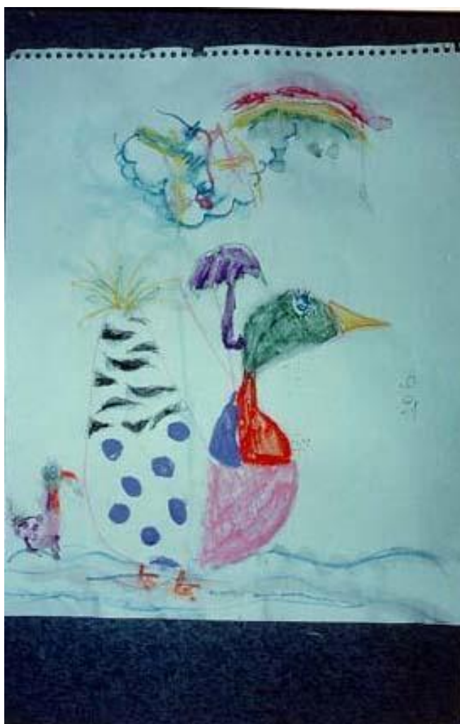
Rys. 2 Bajka Pewnego Razu ... - Rysowanie lub Malowanie

Jeśli masz w domu materiały do rysowania lub malowania albo łatwo je zdobędziesz, możesz spróbować wykonać następujący projekt zatytułowany "Rysunek lub obraz z bajki Pewnego razu... " (patrz Rys. 2). Na początek dziecko powinno wybrać sobie specjalne miejsce do pracy, np. stół, i wybrać środek plastyczny, który najbardziej lubi. Powiedz dziecku, że ten projekt plastyczny będzie dotyczył bajkowego królestwa i zaproponuj następujące słowa by rozpocząć zabawę: "Dawno, dawno temu istniało królestwo, które nawiedził huragan (powódź, trzęsienie ziemi itp.)" a następnie pozwól dziecku uzupełnić resztę historii, rysując lub malując obrazki przedstawiające to, co według dziecka wydarzyło się w tym królestwie. Zachęcaj dziecko do umieszczania na rysunku lub obrazie zwierząt oraz wymyślonych lub prawdziwych postaci.