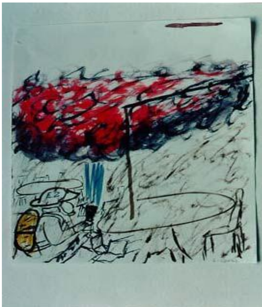
Rys. 3 Pomocne Postacie w Bajkowym Królestwie

stworzenia obrazków poprzez przyklejenie ich do kartki papieru (patrz Rys. 4). Można użyć prostych kształtów, takich jak koła lub trójkąty. Można również wykonać trójwymiarową rzeźbę z ciastoliny lub papieru mache przedstawiającą ducha lub postać dobrego stróża (patrz Rys. 5).