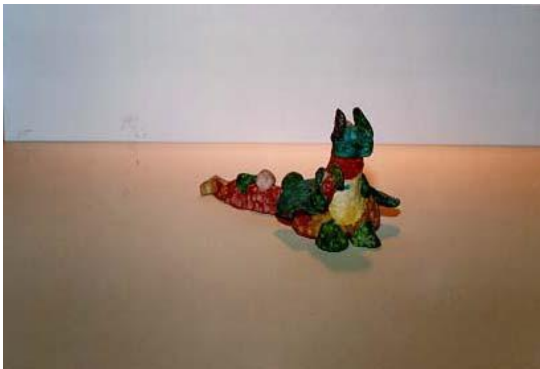
Rys. 5 Duch Opiekuńczy lub Postać Opiekuńcza w 3-D

Dzieci z natury są ciekawe świata, w którym żyją, dlatego można wspólnie z dzieckiem stworzyć dziennik artystyczny poświęcony trzęsieniu ziemi (powodzi itp.), który będzie zawierał zapisy na temat jego własnych doświadczeń związanych z przeżytą katastrofą (patrz Rys. 6). Dziennik artystyczny może być prowadzony w zeszycie ze spiralnym brzegiem i może zawierać sekcje z zakładkami na aktualne wycinki z gazet, miejsca, w których można umieszczać rysunki lub wiersze, które mogą przedstawiać wyobrażenia jakie dzieci miały na temat katastrofy.