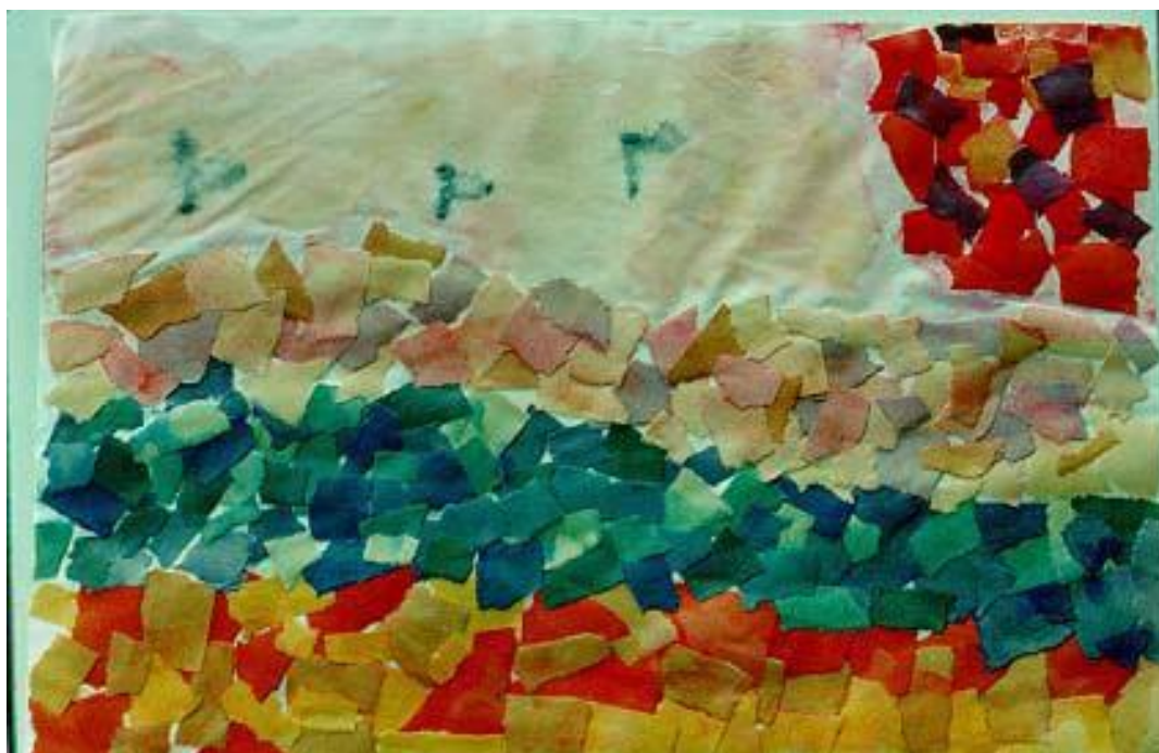
Rys. 4 Tworzenie Obrazu przez Podarcie i Sklejenie Kawałków Papieru