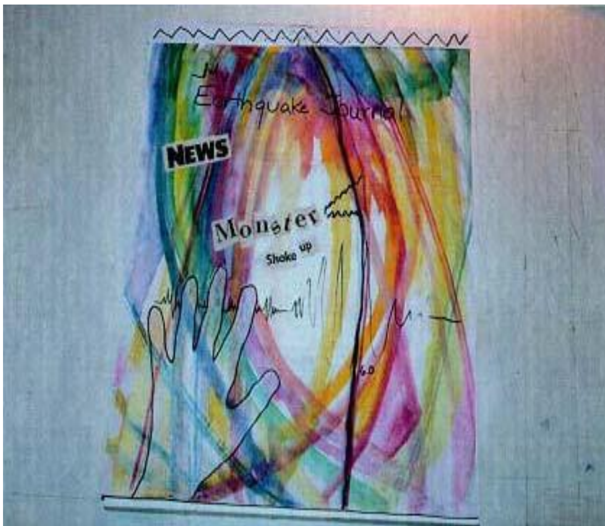
Rys. 6 Dziennik Artystyczny z Katastrofy

Mamy nadzieję, że te propozycje okażą się przydatne i że dzieci rozwiną je na swój własny, niepowtarzalny i bardzo twórczy sposób. Sztuka jest użytecznym sposobem nie tylko na wyrażanie uczuć i wydobywanie ich na zewnątrz, ale także na ich przekształcanie poprzez wykorzystanie form artystycznych w sytuacji doświadczania stresu.